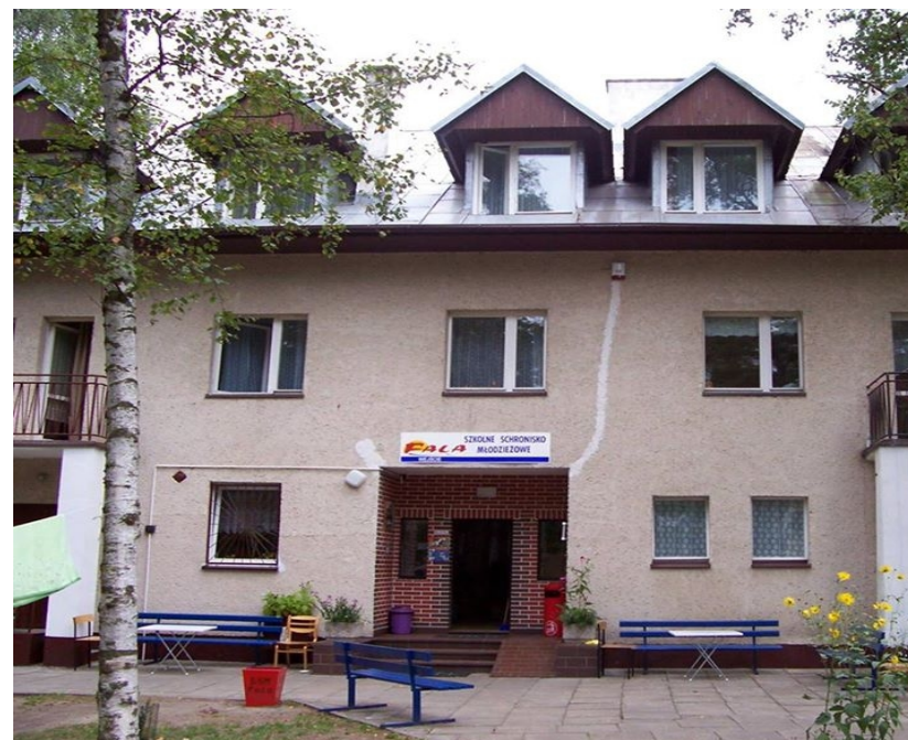
Szkolne Schroniska Młodzieżowego „Fala” w Pobierowie